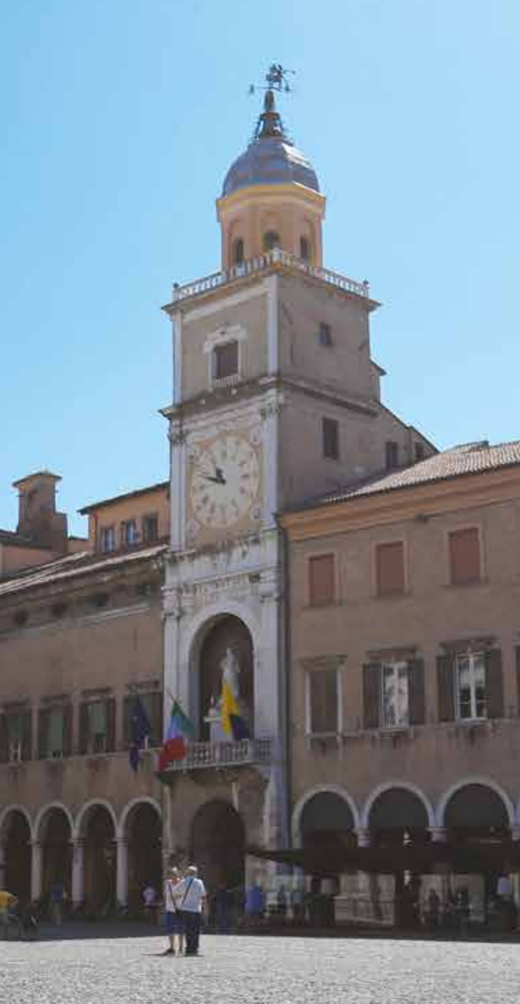
Da sinistra a destra: Palazzo Comunale, Sala della Torre Mozza, Camerino dei Confermati, Sala del Fuoco, Sala del Vecchio Consiglio, Sala degli Arazzi, Stemma di Modena nella Sala dei Matrimoni.