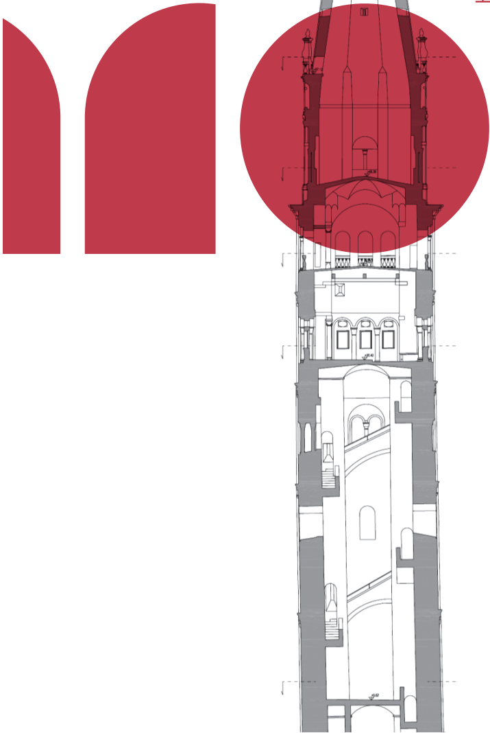
トッレ・チヴァイカ (ギルランディナー)